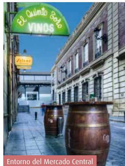
Entorno del Mercado Central