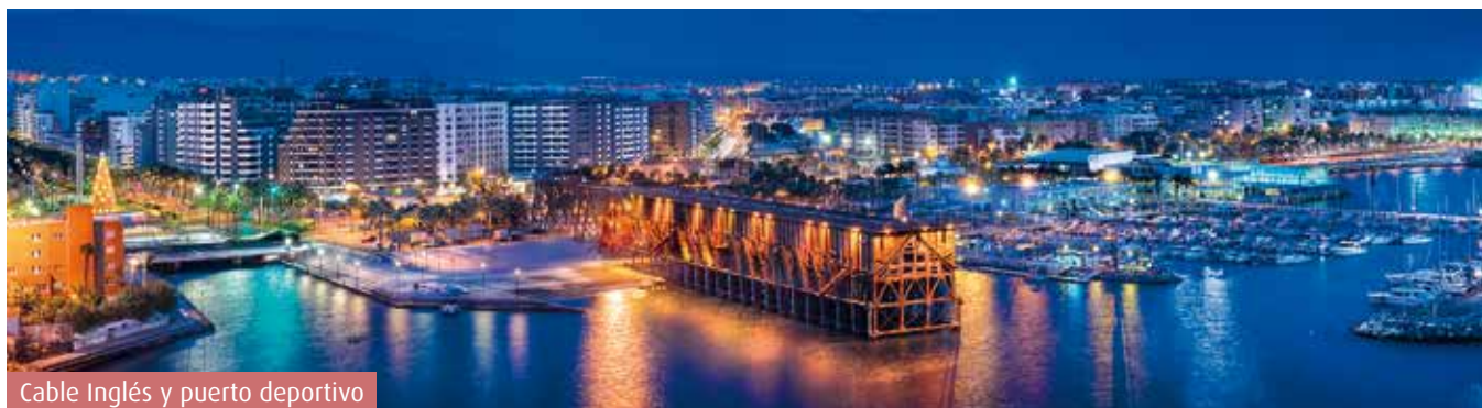
Cable Inglés y puerto deportivo

Durante décadas, de Almería se dijo que estaba lejos de todo. Ubicada en una esquina de la península, sin ser de paso hacia ningún destino, probablemente todo ello confluyó en que los almerienses llegaran a tener de todo sin tener que salir a buscarlo.