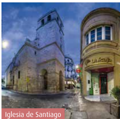
Iglesia de Santiago