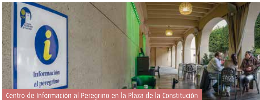
Centro de Información al Peregrino en la Plaza de la Constitución