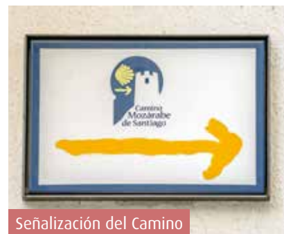
Señalización del Camino

Una forma diferente, ambiciosa e inigualable de afrontar el Camino de Santiago , a través de una Ruta Mozárabe de larga duración, que une la antigua ciudad de Almariyat , que da comienzo en la Plaza de la Catedral, con el punto y final de todos los Caminos, el de la Catedral de Santiago .