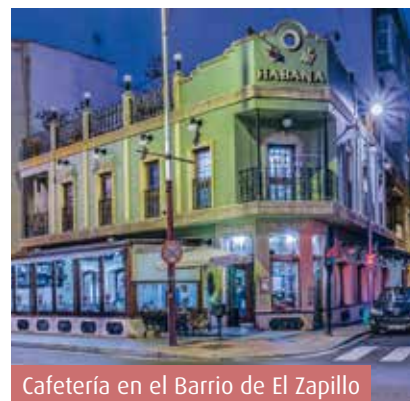
Cafetería en el Barrio de El Zapillo