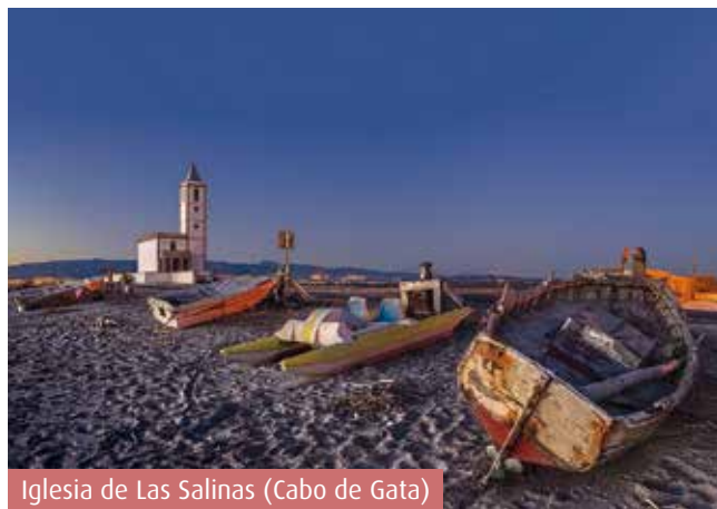
Iglesia de Las Salinas (Cabo de Gata)

lles estrechas de la Almedina y el barrio antiguo y las grandes avenidas del centro y las zonas de expansión, el Paseo Marítimo abierto al Mediterráneo, un bar en cada esquina y cada uno con sus tapas más típicas, museos, refugios, historias y pasiones de mil en mil.