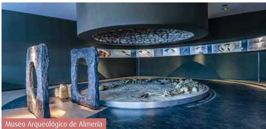
Museo Arqueológico de Almería