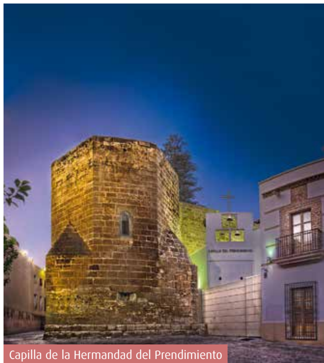
Capilla de la Hermandad del Prendimiento

Tras el respetuoso descanso del Sábado Santo , la Semana Santa se cierra con la procesión del Jesús Resucitado , el domingo, con un paso que parte y llega a la Catedral de la Encarnación , en otro de los grandes momentos de la Semana de Pasión almeriense.