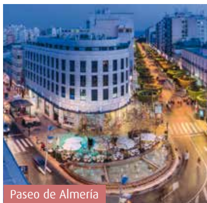
Paseo de Almería

Una zona idónea para comer, en la zona del Parque Nicolás Salmerón, el Puerto Deportivo y el Paseo Marítimo . Desde esta zona, las playas de la ciudad se abren al visitante para un paseo tranquilo o una tarde de café y descanso en los numerosos bares y cafés del Paseo Marítimo, también animado en la noche, al igual que el casco histórico.