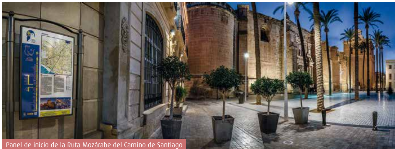
Panel de inicio de la Ruta Mozárabe del Camino de Santiago

Una ruta, la Mozárabe , que nos enseña Almería desde otro punto de vista y que nos pasea por sus encantos bajo el embrujo del Camino y de la vida hace siete siglos.