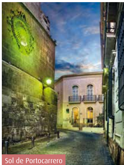
Sol de Portocarrero

Perderse en las calles estrechas y empinadas de la Almedina camino de la Alcazaba, adentrarse en su casco histórico, pasear por la Plaza de la Constitución , la Calle Real , el centro peatonalizado, el Paseo o la Rambla , son otras opciones nada desdeñables para disfrutar de una ciudad tranquila, manejable, abierta, de un clima inigualable y, en definitiva, encantadora.