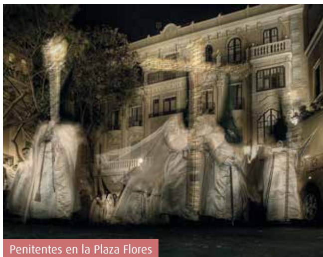
Penitentes en la Plaza Flores

Mercedes , junto a la Plaza de Toros; el Gran Poder , desde la Iglesia de San Pío X , en El Zapillo; y la Pasión , desde Santa Teresa , en Oliveros.