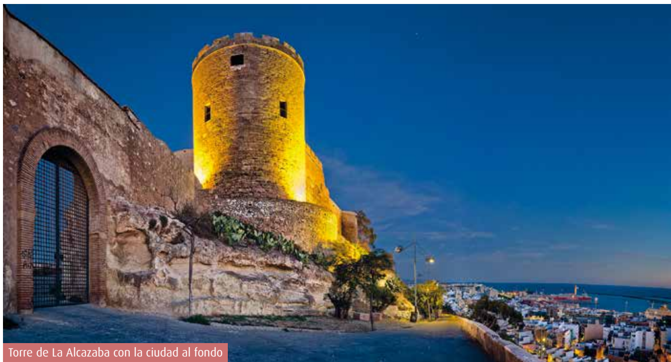
Torre de La Alcazaba con la ciudad al fondo